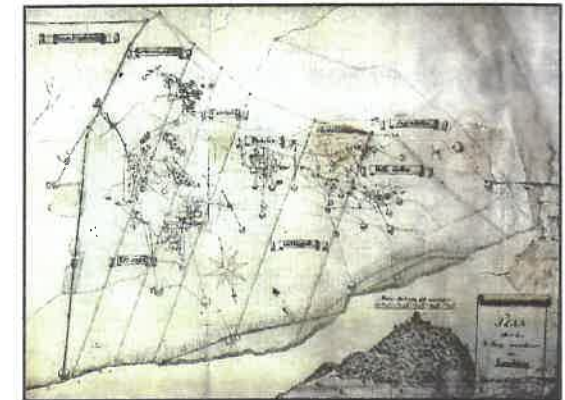
Alter Plan der Gruben am Landsberg